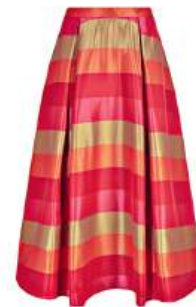
ST. EMILE 116 271 35 € 259,95