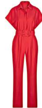
TALBOT RUNHOF X PETER HAHN 114 719 35 € 229,95