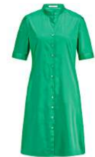
PETER HAHN 116 256 35 € 149,95