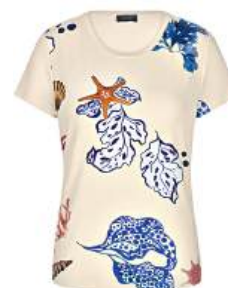
MYBC 806 707 35 € 59,95