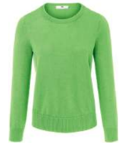
PETER HAHN 870 611 35 € 59,95