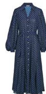
UTA RAASCH 115 689 35 € 229,95