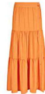
UTA RAASCH 114 774 35 € 149,95