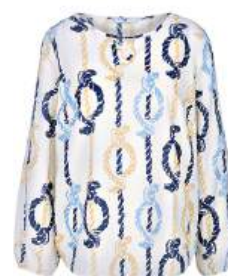
PETER HAHN 116 787 35 € 89,95