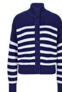
PETER HAHN 115 396 35 € 99,95