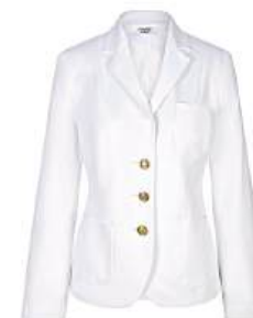
MAYFAIR BY PETER HAHN 104 720 35 € 199,95