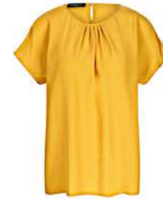
FADENMEISTER BERLIN 116 173 35 € 99,95