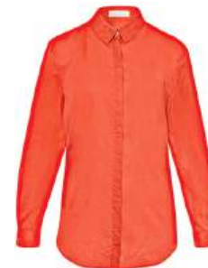
ST. EMILE 117 349 35 € 149,95