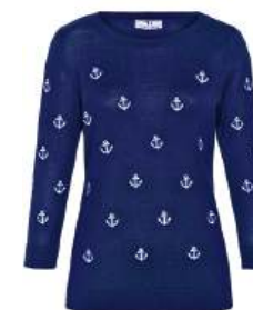
PETER HAHN 898 502 35 € 79,95