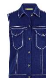
FLUFFY EARS 115 468 35 € 189,95